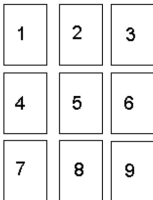
Figure I : les 9 feuilles