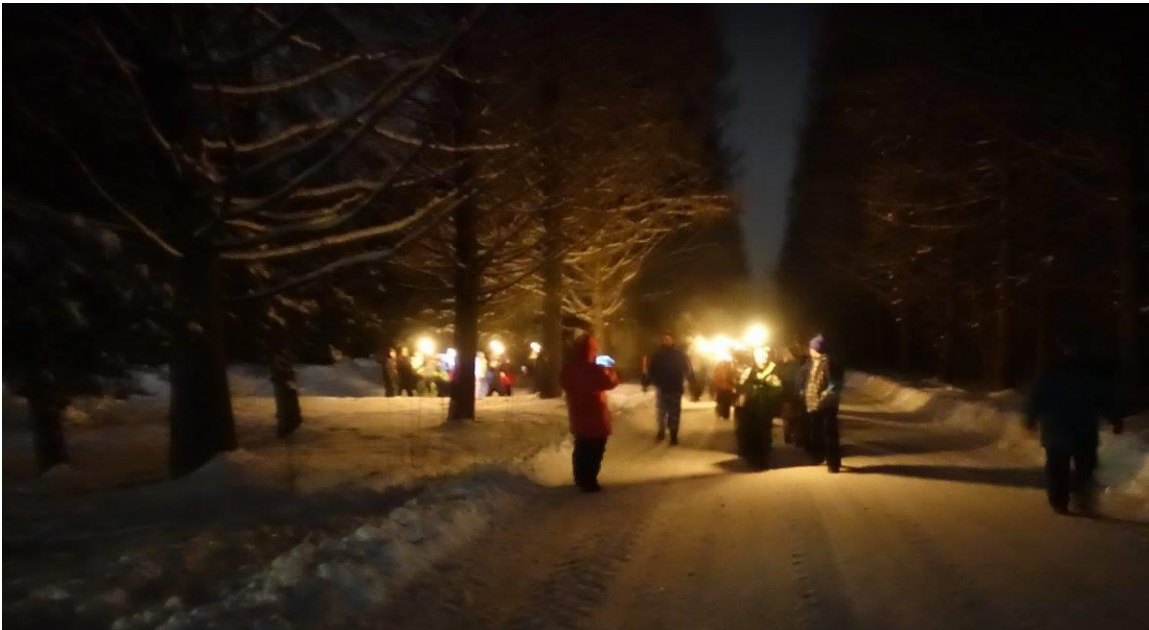
La dite marche aux flambeaux

Comme animateur, j'ai vu des jeunes stressés et inquiets de quitter leurs parents, passer plusieurs nuits sans leurs parents et être fier d'eux-mêmes. J'ai vu des jeunes tenir et marcher avec un flambeau pour la première fois, je vous le garantis, leurs yeux étaient plus lumineux que la flamme de leur flambeau. Simple boîte de conserve vissée à un bout de bois, mais une véritable flamme olympique pour eux.